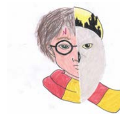
3. Platz: Jamie Munafo, Abtwil