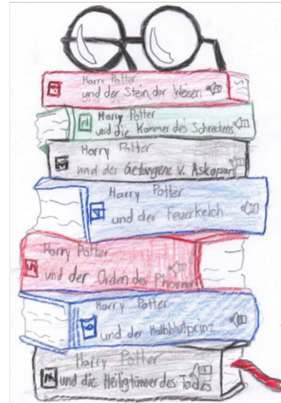
Gewinner des Malwettbewerbs: Noel Forster, Abtwil